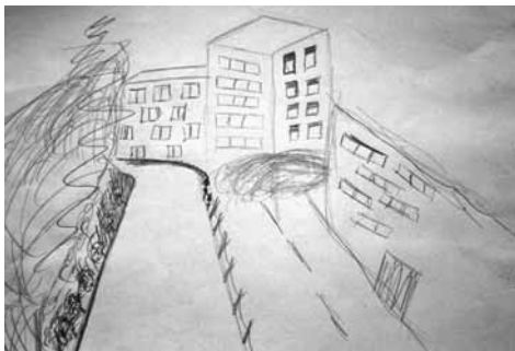
First drawing Dynamic images, very successful

In the control groups the results were as follows: in the group of the pupils regarded as very successful, 65% got higher marks than in the initial testing and 35% got the same; in the group of the pupils that were regarded as successful, 70% got higher marks, 30% got the same marks as in the initial testing; in the group regarded as less successful, 42% got the same marks as in the initial test while 58% got higher marks than in the initial test (Figure 2).