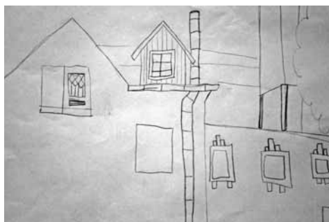
First drawing Dynamic images, less successful