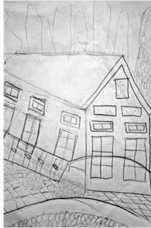
Figure 2: Examples of pupils' works from the control group: the first drawing is presented on the left side, the second drawing produced by the same pupil after the use of static didactic means is presented on the right side.