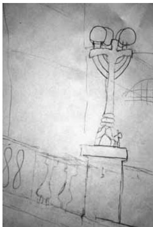
First drawing Dynamic images, very successful